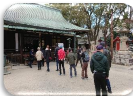
順番に原田神社に初詣に行き 皆さん、それぞれお願いしました。