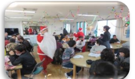
サンタさんからプレゼントを受け取りました。