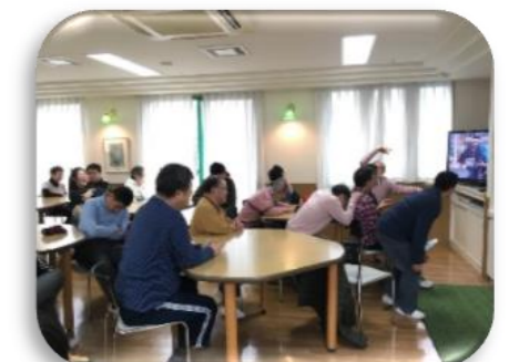
順番を待っている間、みらい食堂で「ドリフターズ」を見ました。 皆さん真剣にそして大爆笑でした。